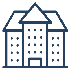
Investigación / Ministerio Público