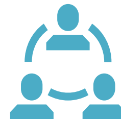
Medidas no privativas de la libertad